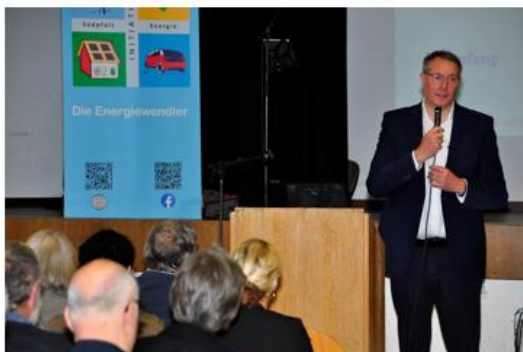
Festrede: Alexander Schweitzer, Ministerpräsident von RLP