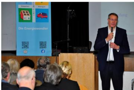
Festrede: Alexander Schweitzer, Ministerpräsident von RLP