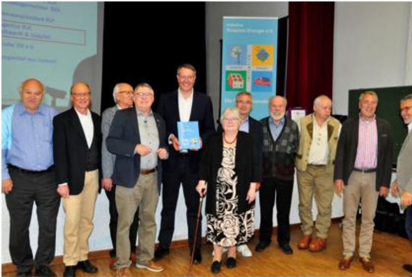
Ein stolzer Vorstand!